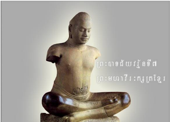
"ទុក្ខរបស់ប្រជារាស្ត្រគឺជាទុក្ខរបស់ព្រះមហាក្សត្រ។"

មជ្ឈមណ្ឌលទស្សនវិជ្ជាអនុវត្តន៍និងសីលធម៌កម្ពុជា មានទស្សនៈវិស័យចង់ឃើញសង្គមមួយដែលមានយុត្តិធម៌ សន្តិភាព និងចីរភាពដែលមនុស្សរស់នៅប្រកបដោយភាពថ្លៃថ្នូរពេញលេញ និងគតិបណ្ឌិត។